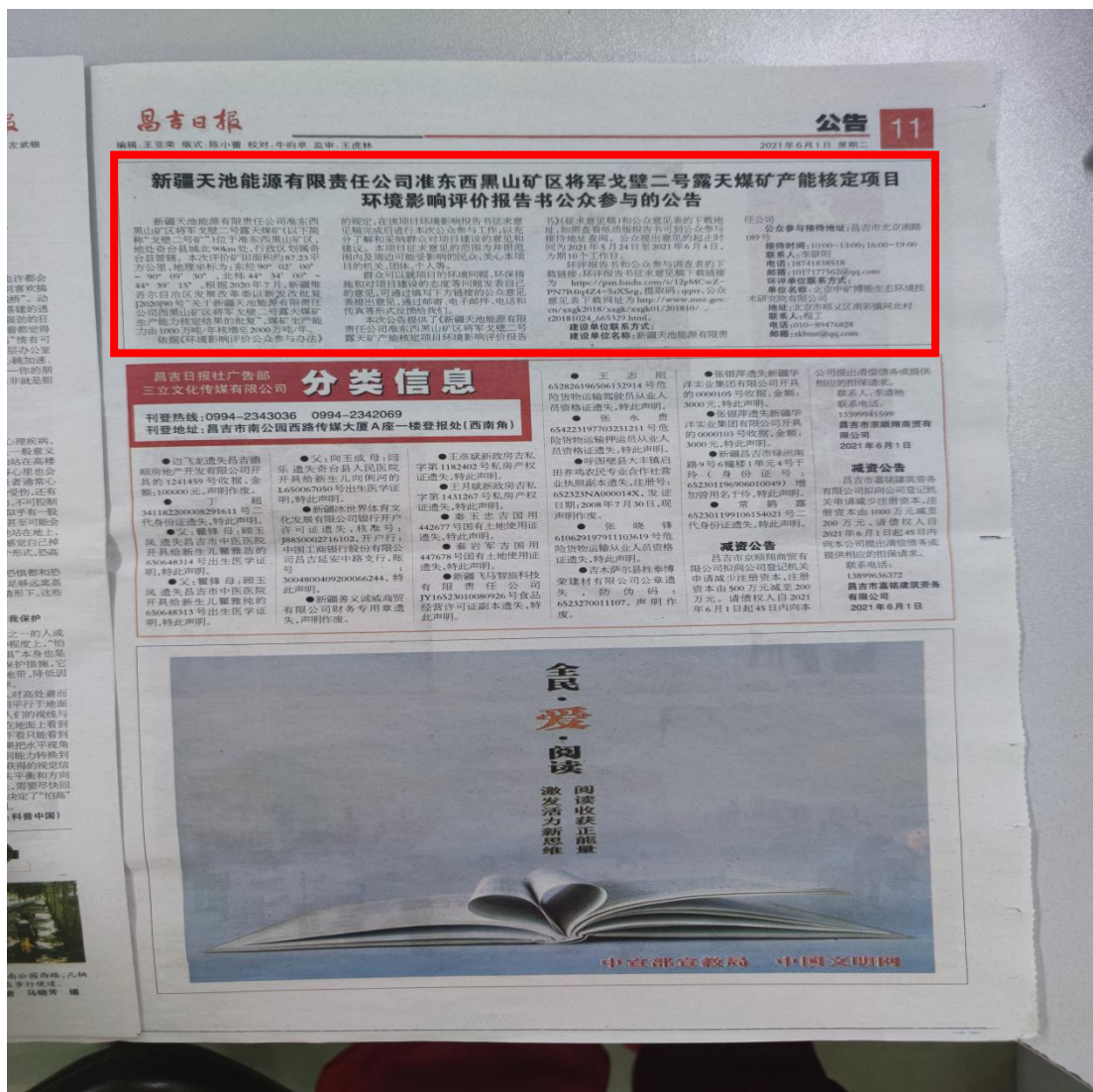
6月1日报纸公告 图3 项目报纸公告情况