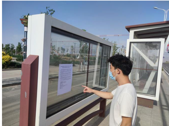
五彩湾工业园公交站张贴公告