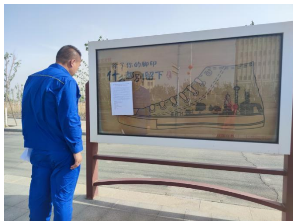
准东管委会公告栏张贴公告