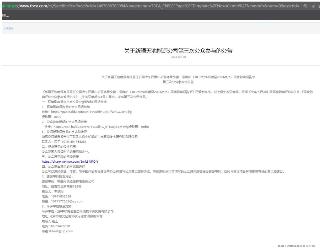
图 5 第三次网络公示截图