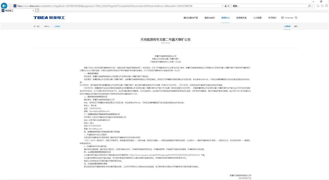
图 1 第一次网络公示环评信息情况