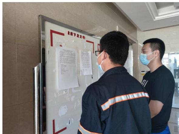
将军戈壁二号煤矿张贴公告